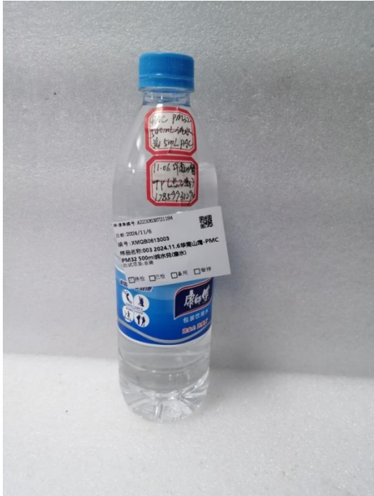
2024.11.6 华南山鹰-PMC PM32 500ml 纯水兑