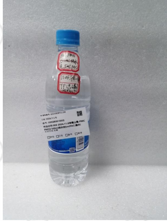
2024.11.6 华南山鹰-PMC PM33 500ml 纯水兑 5ml PAC