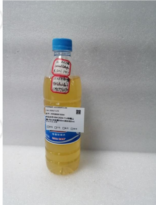
2024.11.6 华南山鹰-PAC 水处理 500ml 纯水兑 5ml PAC